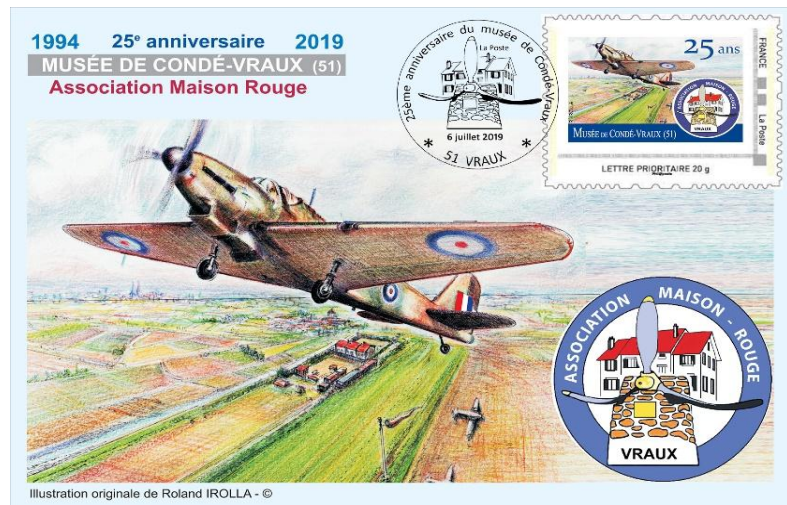
Carte illustrée par R.Irolla (photo non contractuelle) représentant le terrain de Maison Rouge.