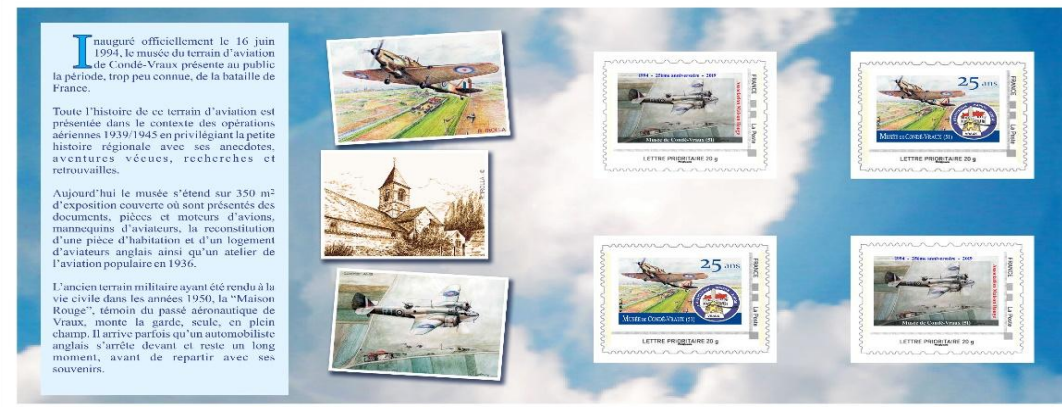
Intérieur du livret