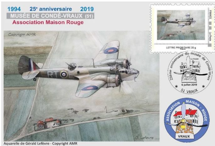
Carte d'un Blenheim d'après une aquarelle de G. Lefèvre. (photo non contractuelle)