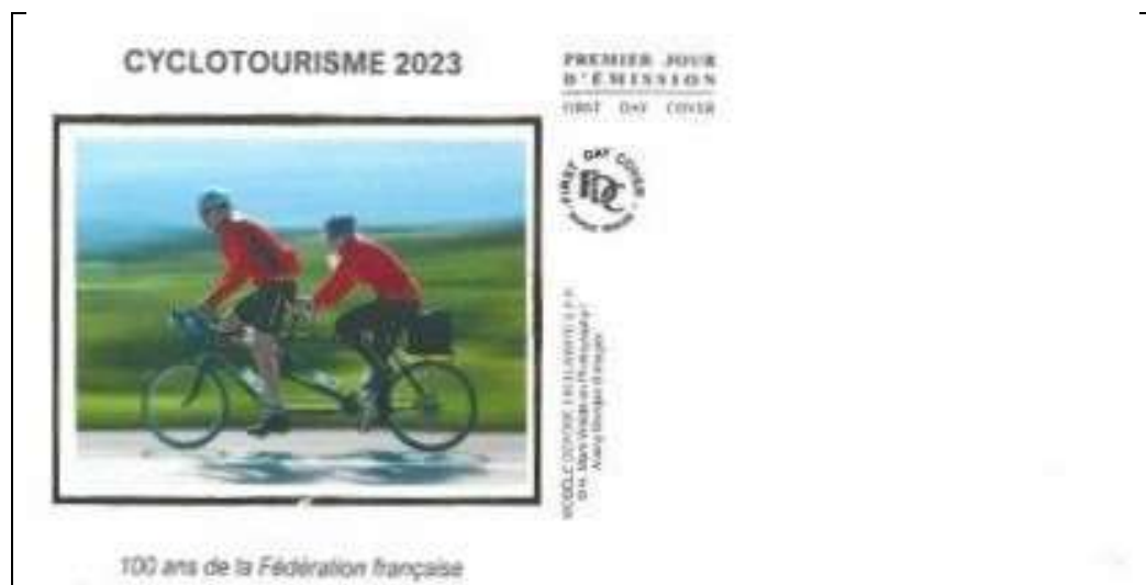
Enveloppe soie "Farcigny"