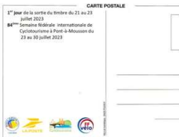
Verso carte postale