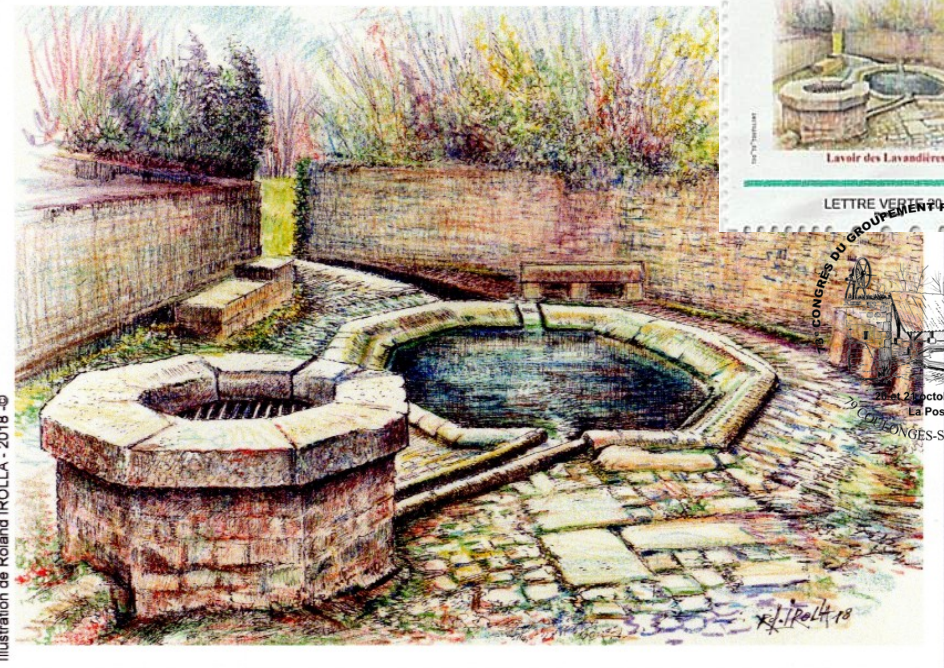
79 - COULONGES-SUR-L'AUTIZE : La Fontaine-Lavoir de la rue des Lavandières.