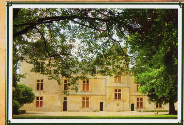
20 et 21 OCTOBRE 2018