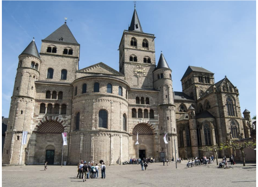
Dom und Liebfrauenkirche

Trier kann viele Titel auf sich vereinen: älteste Stadt Deutschlands, Zentrum der Antike, Touristenmagnet, Großstadt, Hauptstadt. Moment – Hauptstadt? Aber sicher. Zumindest wenn der Besucher sich gut 1700 Jahre zurückversetzen lässt. Damals war Trier eine von vier Hauptstädten des Römischen Reichs, Kaiserresidenz, Weltmetropole, Handelszentrum und Finanzzentrum. Aus dieser Zeit resultiert die Bezeichnung „roma secunda“ (aus dem Lateinischen übersetzt: das zweite Rom) für die Stadt. Sieben römische UNESCO-Welterbestätten im Stadtzentrum zeugen bis in die Gegenwart davon, die mittelalterliche Liebfrauenkirche als achte macht die Pracht späterer Jahrhunderte sichtbar.