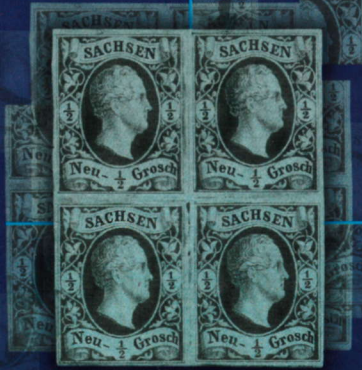
Sachsen, der Farbfehldruck 1/2 Neugroschen schwarz auf mattpreußischblau im 4er-Block. Michel-Nr. 3F