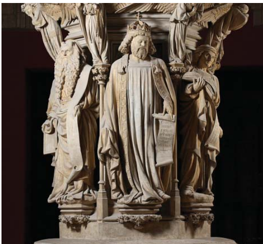
Moïse et David, Puits de Moïse. Moulage par Jules Fontaine, 1880 - polychromie par Marcella Boesch, 1948 © CAPA/MMF/David Bordes