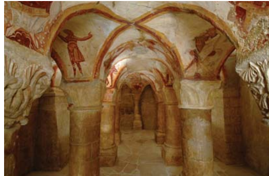
Tavant, église Saint-Nicolas, crypte. Copie à grandeur par Marthe Flandrin et Simone Flandrin-Latron, 1941