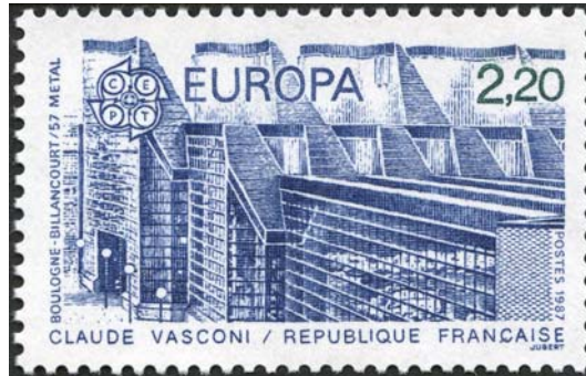
Boulogne-Billancourt, Atelier 57 Métal - Timbre-poste émis le 27 avril 1987. Dessiné et gravé par Jacques Jubert. Impression en taille-douce. Série Europa sur le thème « Architecture moderne »

Enfin, des événements à destination des différents publics seront programmés.