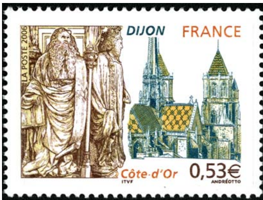
Dijon, chartreuse de Champmol - Timbre-poste émis le 10 avril 2006. Dessiné et gravé par Claude Andréotto. Impression en taille douce. Série Commémoratifs et divers : 6 e centenaire de la mort de Claus Sluter. Salon philatélique de printemps 2006 © Coll. L'Adresse Musée de La Poste / La Poste / ADAGP, Paris 2015