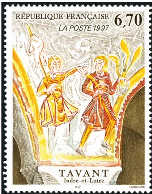
Timbre-poste émis le 3 mars 1997, dessiné par Odette Baillais, gravé par Jacky Larrivière Impression en taille-douce. Série artistique © Coll. L'Adresse Musée de La Poste / La Poste / DR

Le parcours Archi-timbrée, en partenariat avec l'Adresse Musée de La Poste, propose une mise en regard de timbres représentant des chefs-d'œuvre du patrimoine architectural français et les œuvres qu'ils représentent. Ces œuvres se trouvent en grandeur nature au sein des collections de la Cité de l'architecture & du patrimoine.