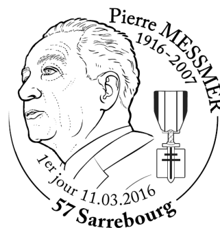
Maquette non contractuelle Visuel d' disponible sur demande