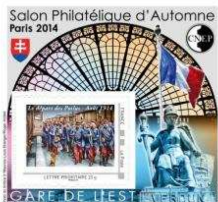
Création Claude Andreotto